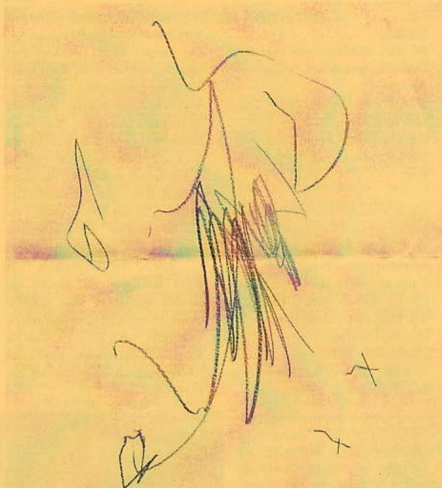
Timo van Daech 3jaar en een beetje